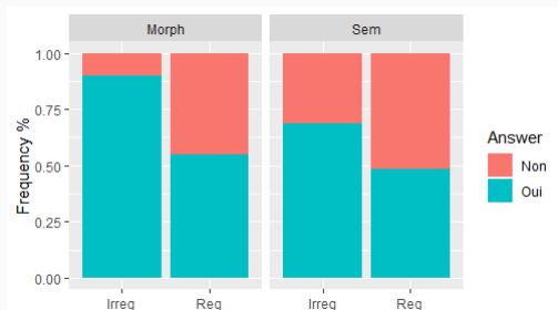
FIGURE 1 – Taux de détection selon chaque condition